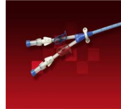
انواع کاتتر شالدون و کاربرد آن‌ها

کاتتر شالدون دیالیز یک لوله‌ی نرم و انعطاف‌پذیر است که از طریق گردن یا شانه‌ی بیمار وارد سیاهرگ مرکزی گردن می‌شود. این لوله می‌تواند به دو صورت موقتی و یا دائمی در داخل رگ‌های بیمار قرار بگیرد. کاتتر شالدون دیالیز دارای دو لوله است که یکی از آن‌ها برای خروج خون از بدن بیمار کاربرد دارد. سپس خون را وارد دستگاه دیالیز می‌کند تا تصفیه شود. بعد از تصفیه شدن، خون مجدداً به داخل بدن بیمار برمی‌گردد.